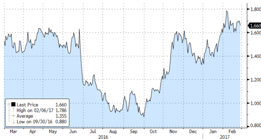
Evolución de la Rentabilidad del bono español a 10

En cuanto a la publicación de datos macroeconómicos, los datos siguen sorprendiendo al alza y apoyan la visión de una expansión económica global. Los bancos centrales siguen apoyando el crecimiento con sólo la Fed norte-americana en modo restrictivo, pero aun así aplicando un sesgo muy acomodaticio, sin dar indicaciones de cuando se prevé la próxima subida de tipos de interés.